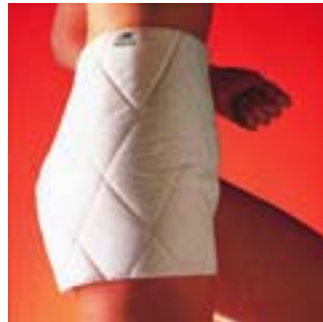
PZ-Nr. 301 350 0 MEDIPOLAN-Hüftgelenk