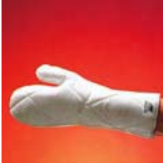
PZ-Nr. 301 337 4 MEDIPOLAN-Fäustling

Nebenwirkungsfrei · MEDIPOLAN · Energie gegen Schmerzen