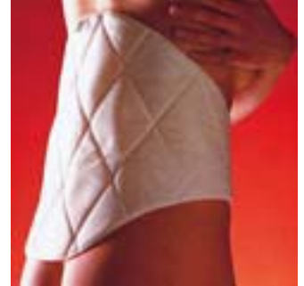
PZ-Nr. 301 348 6 MEDIPOLAN-Lendenwirbelsäule (LWS) medium, ( 35 x 60 cm)

Verkrampfungen werden gelöst, Entzündungsstoffe durch bessere Durchblutung abtransportiert.