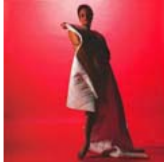
PZ-Nr. 397 521 6 MEDIPOLAN-Bettunterlage, groß (ca. 130 x 200 cm)